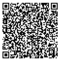
申込フォームQRコード

申込フォーム（Excel）は当会議HPからダウンロードできます。 https://jcold.or.jp/j/activity/ 申し込み確認後請求書を送付いたします。